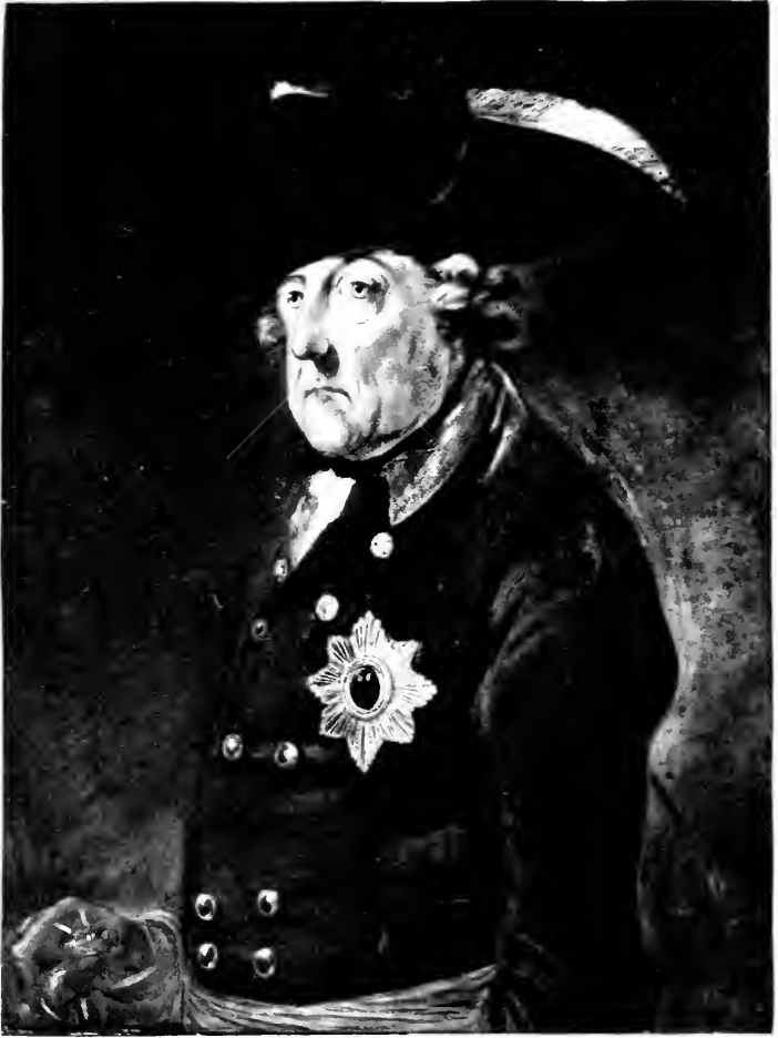
LE GRAND FREDERIC L'Empereur du Nord (d'après un tableau par Vanloo)